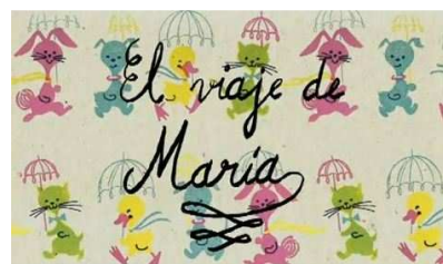
Le voyage de Maria

Présentation du film sur le blog de la Fondation Orange : www.blogfondation.orange.com/2010/09/23/le-voyage-de-maria-nouveau-court-metrage-danimation-pour-mieux-comprendre-lautisme/